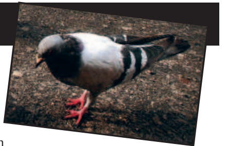
Laatste Nieuws. “Bovendien krijgt het duivenmelken zo een jonger imago.”

In het West-Vlaamse Ichtegem leren de 10-jarigen in het klasje van juf Suzy Schollier duivenmelken. “Geen betere manier om ze wis- of natuurkunde bij te brengen”, aldus de juf-duivenmelkster in Het